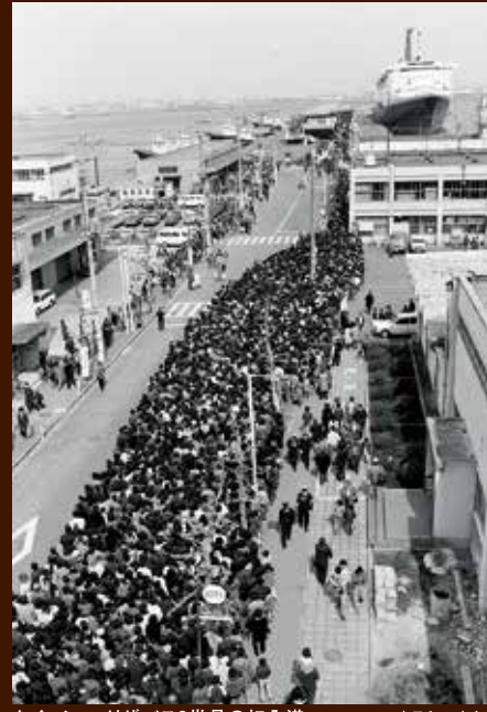
クイーン・エリザベス2世号の初入港