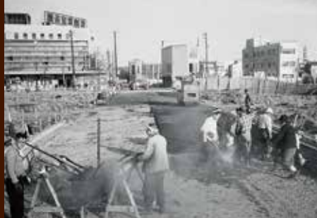
接收解除のすずむ関内

ワークショップ「アニメでつくる横浜港」ほかイベント盛りだくさん! 日程：8月16日(土)・17日(日) 共催：横浜ユーラシア文化館