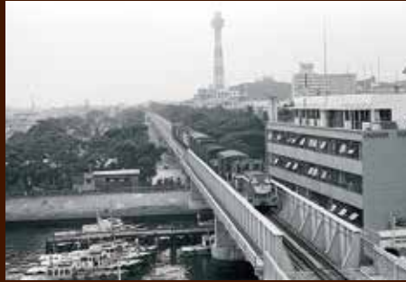
山下臨港鉄道の開通式