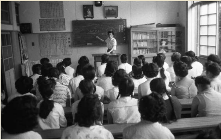
④婦人更生施設の女性たち 1957(昭和32)年