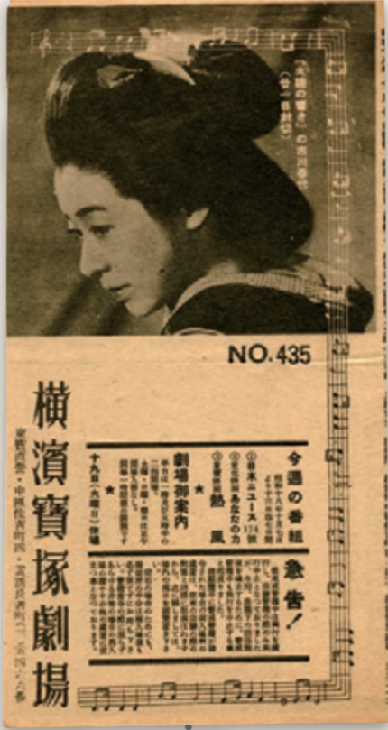
④-1, 2『横浜宝塚劇場』No.435 1943（昭和18）年10月7日 空襲時の注意事項が「緊急!」として表記され、これまで空襲警報中のみ興行中止としていたのを、警戒警報中も中止するとしている。見開きには、「このプログラムは必ず慰問袋に入れて戦地へお送り下さい。」という文面も見られるようになる。