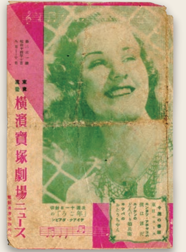
①『横浜宝塚劇場ニュース』第231号 1939（昭和14）年10月8日