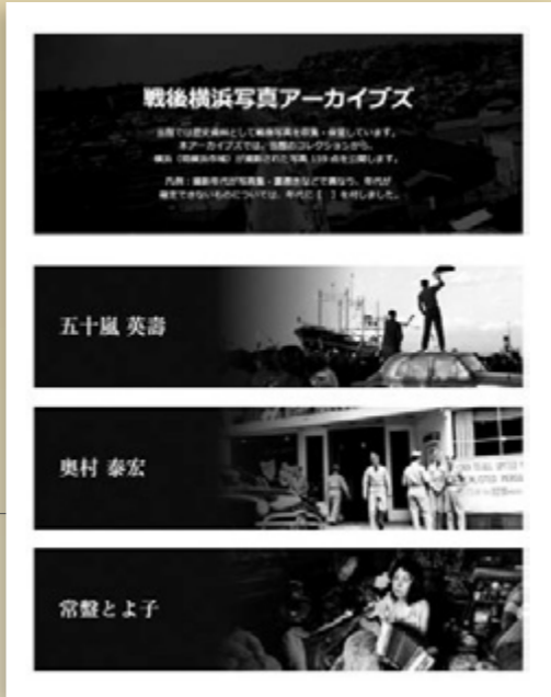
①戦後横浜写真アーカイブストップ画面

に横浜の街と人びとをフィルムに収めてきた。そこには戦争の傷跡を残しつつ復興へと動きはじめた街の活気、豪華客船が寄港する大棧橋での出会いと別れの間模様、そして高度経済成長とともに大きく変貌する臨海部の状況など、「写真記者」としての視点で切り取られた横浜のさまざまな情景を見ることができ