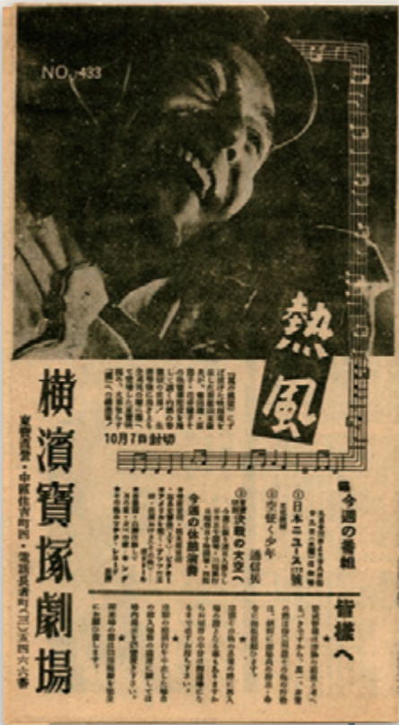
⑥『横浜宝塚劇場』No.433 1943（昭和18）年9月23日 ②では見られなかった空襲時の注意が、「皆様へ」というかたちで表記されている。