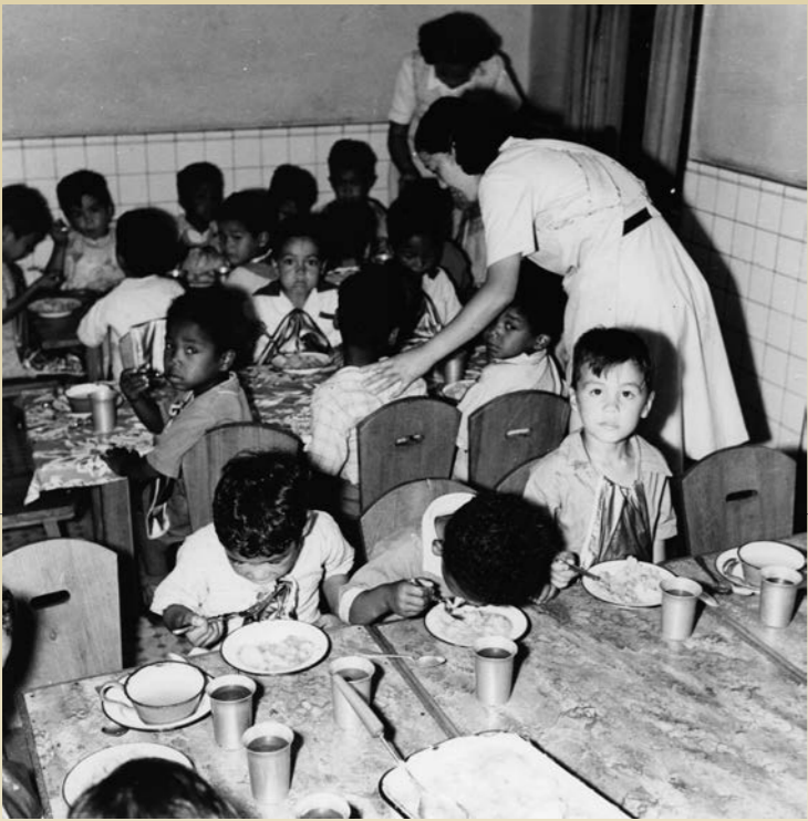
③聖母愛児園の食事風景 1952(昭和27)年