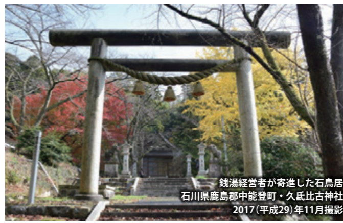
銭湯経営者が寄進した石鳥居 石川県鹿島郡中能登町・久比古神社 2017(平成29)年11月撮影