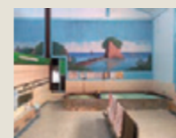
●表紙図版 西区「朝日湯」のペンキ絵(見附島) 丸山清人画 2024(令和6)年5月撮影