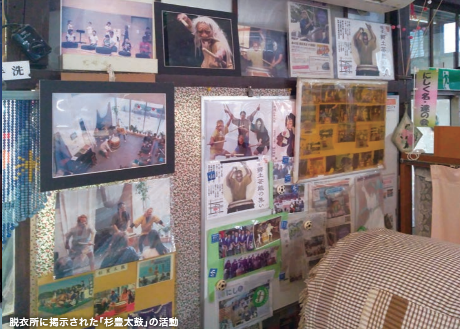
脱衣所に掲示された「杉豊太鼓」の活動