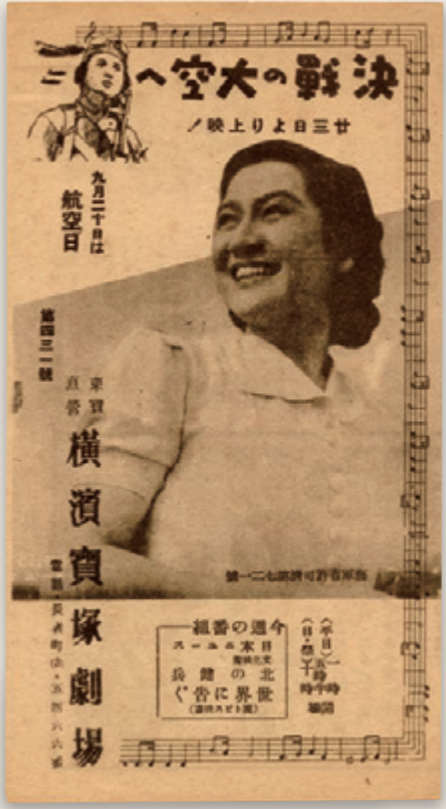
②『横浜宝塚劇場』第431号 1943（昭和18）年9月9日 ①と比べて単色刷りになり、形も小さくなっている。