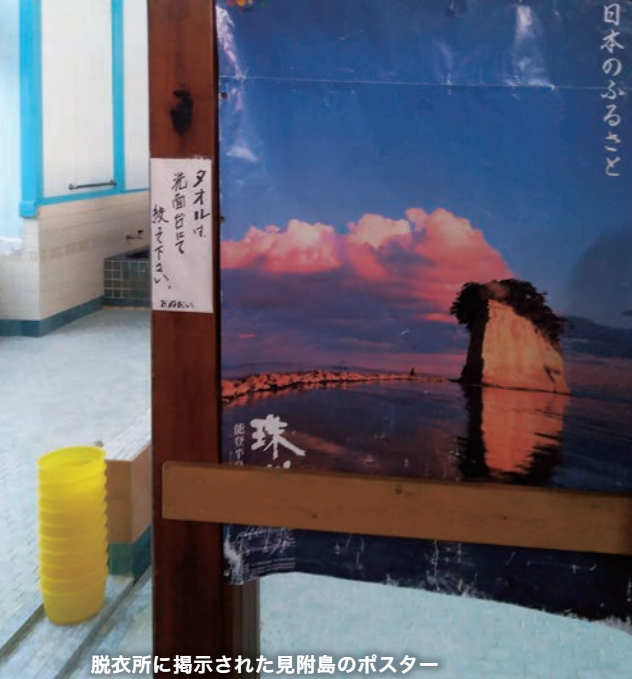
脱衣所に掲示された見附島のポスター