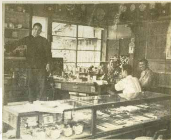
谷崎時計店の店内 昭和10年代