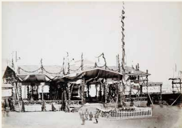
"The Far East" (1872年10月16日号)