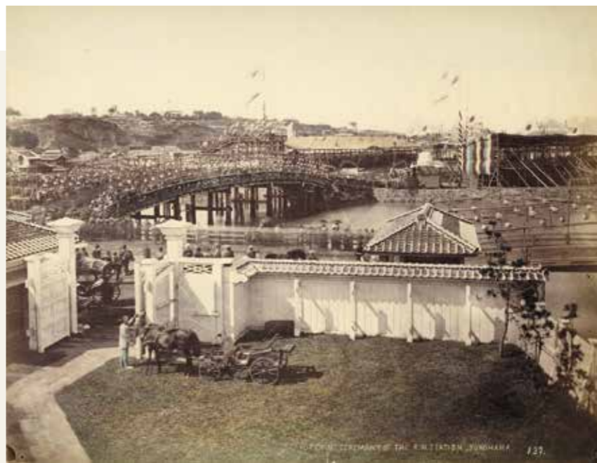
図1 横浜駅での開業式 当館蔵(山本博士氏寄付金により購入)

当館では、平成26(2014)年10月4日から同27年1月30日の会期で、コーナー展「ハマに鉄道が走った日」を開催した。このコーナー展では、明治5年9月12日(1872年10月14日)に国内で初めて鉄道が開通したときの記念式典の様子を撮影した着色写真を初公開した(図1)。開業式当日に横浜で撮影されたオリジナル写真が発見されたのは初めてのことで、本稿ではその貴重な資料について紹介したい。