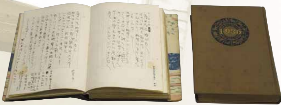
下平政熙氏の日記 昭和16年(左)、昭和11年 下平修嗣氏蔵