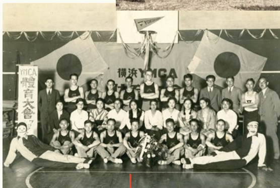
横浜YMCA体育大会 1932(昭和7)年