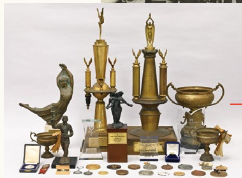
横浜ゆかりのメダリスト 池田敬子氏所蔵の記念品 池田敬子氏所蔵